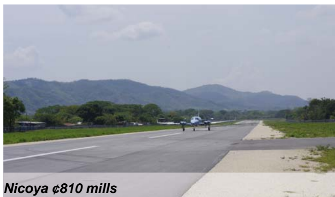
Nicoya ¢810 mills