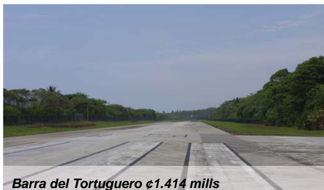
Barra del Tortuguero ¢1.414 mills