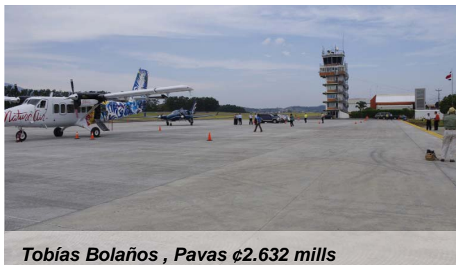
Tobías Bolaños , Pavas ¢2.632 mills