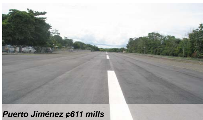
Puerto Jiménez ¢611 mills