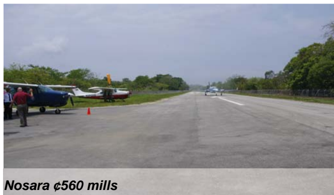
Nosara ¢560 mills

Entre las pistas recientemente inauguradas se encuentran las siguientes: