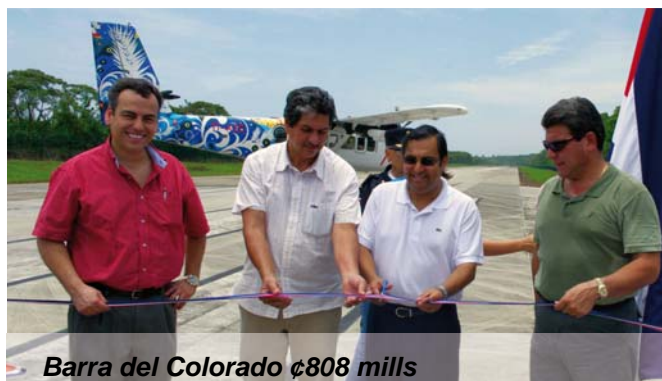
Barra del Colorado ¢808 mills

Durante los últimos días del mes de abril, el Presidente de la República, Oscar Arias y el Ministro de Obras Públicas y Transportes, Francisco Jiménez, inauguraron varias pistas de aterrizaje de aeródromos locales.