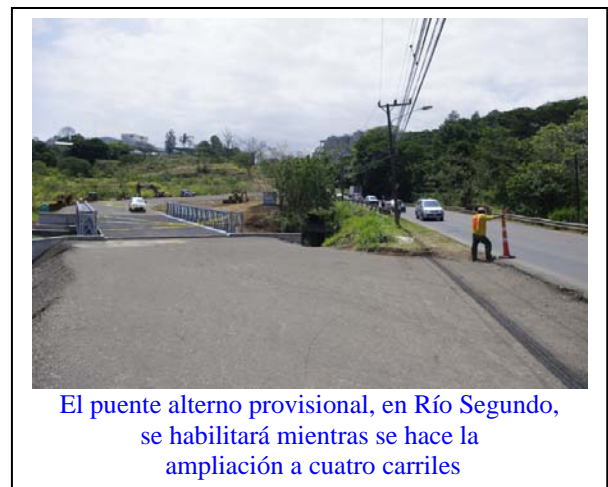
El puente alternativo provisional, en Río Segundo, se habilitará mientras se hace la ampliación a cuatro carriles

Las labores financiadas por el Consejo Nacional de Vialidad (CONAVI), comenzaron el pasado 23 de febrero, luego que la Compañía Nacional de Fuerza y Luz iniciara la remoción de la postería en el derecho de vía.