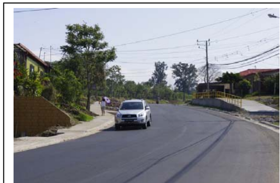
Las aceras se complementarán con la demarcación como parte de la seguridad vial.

El presupuesto para esta obra contempla la demarcación horizontal y el señalamiento vertical con señales, además de la colocación de captaluces sobre la calzada. Estos trabajos estarán listos a final de mes.