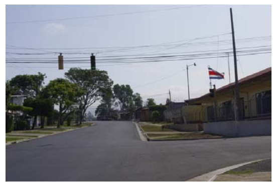
Los accesos seguros a centros educativos, con semáforos, forman parte del proyecto

Las obras ejecutadas tienen un valor de €1.799.846.270, según detalló el Ministro de Obras Públicas y Transportes, Lic. Francisco Jiménez. La antigua ruta, comprendida entre el Bar Los Mangos y el Bar Guima, era insuficiente para canalizar el flujo vehicular que circula por ella, principalmente por ser un camino angosto. En virtud de esto, se realizaron trabajos de ampliación para dar cabida a dos carriles, uno en cada sentido, con anchos de 3,65 metros de ancho cada uno y espaldones de un metro ancho cada uno, además de cordón de caño.